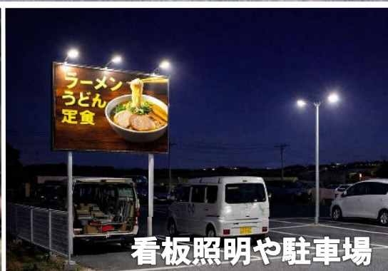
看板照明や駐車場